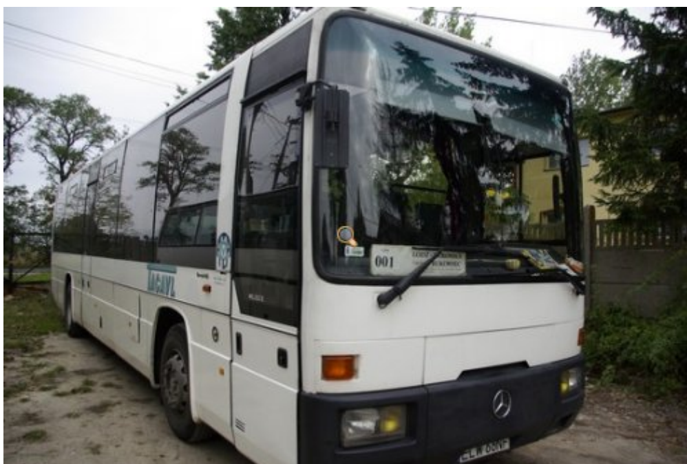
Dowóz dzieci do szkół