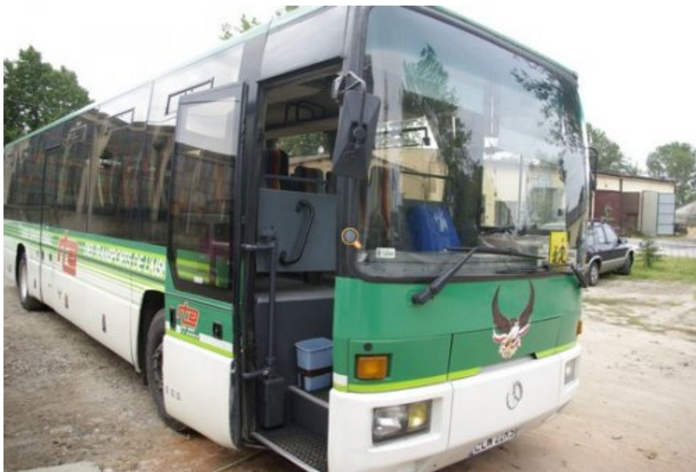
Dowóz dzieci do szkół